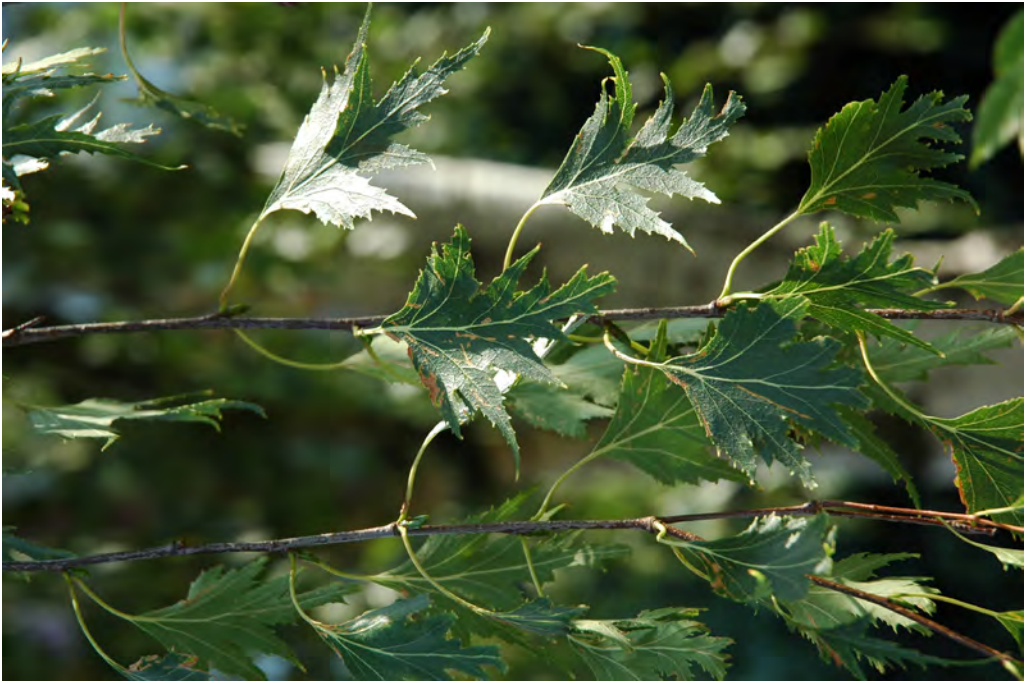
Abb. 3 Die Schlitzblättrige Birke ( Betula pendula ‚Dalecarlica‘), von BECHSTEIN (1810) als Ahornblättrige Birke unter Betula hybrida BECHST. abgehandelt.