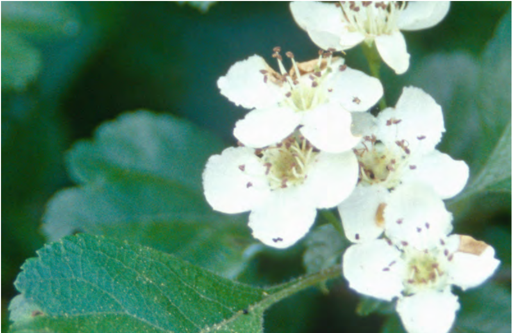
Abb. 4 Der Bastard von Zwei- und Eingrifflichem Weißdorn ( Crataegus laevigata x C. monogyna ) wurde von J. M. BECHSTEIN als C. x media BECHST. beschrieben.

(Abb. 5), d. h. Crataegus x media BECHST. ist der korrekte Namen für den Bastard C. laevigata x C. monogyna .