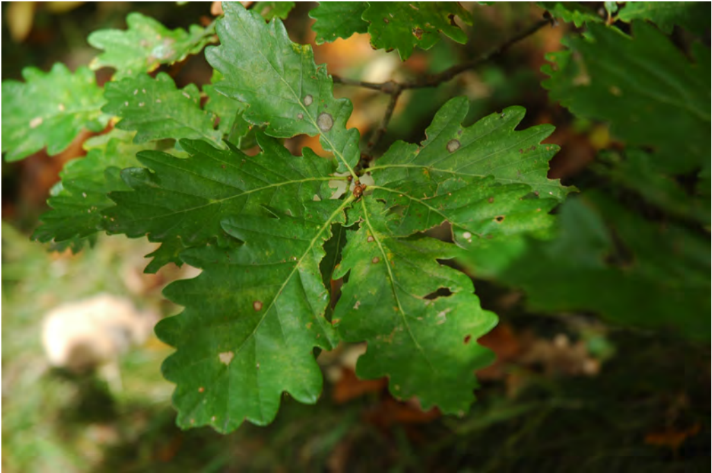
Abb. 6 Der von J. M. BECHSTEIN als Quercus x rosacea BECHST. beschriebene Bastard von Trauben- und Stiel-Eiche ( Quercus petraea x Q. robur ) am Burgberg bei Waltershausen.

Bastarderzeugung-Angaben, allein die Erfahrung lehrt doch, dass die sträubende Natur auf diese Weise zuweilen sich zu solcher Fortpflanzung zwingen lässt und die zusammenschmolzenen Eigenschaften beyder scheinen dieser Behauptung Bestätigung zu geben.“ Dieser Meinung schließen sich fast alle Autoren an. So wird Q. hybrida als Namen für den Bastard von Stiel- und Trauben-Eiche verwendet (ASCHERSON & GRAEBNER 1898) oder als Synonym von Q. xrosacea (z. B. BORBÁS 1886, BORNMÜLLER 1920, GOVAERTS & FRODIN 1998) aufgefasst. Dies trifft nach BORNMÜLLER (1920, S. 292), der die Eichen am Ort des Wirkens von BECHSTEIN studierte, auch für Q. decipiens zu: „Meine Pflanze“ (vom Burgberg) repräsentiert eine recht instruktive Mittelform..., ließe sich mit gleichem recht aber auch als Q. hybrida ansprechen, auch Q. rosacea nichts anderes als eine Bastardform.“ Dem schließt sich der Verfasser an, wenn es auch abweichende Meinungen hierzu gibt, denn GOVAERTS & FRODIN (1998) stellen Q. decipiens zur Trauben-Eiche ( Q. petraea subsp. petraea ). Q. hybrida BECHST. und Q. decipiens BECHST. sind Synonyme von Q. xrosacea .