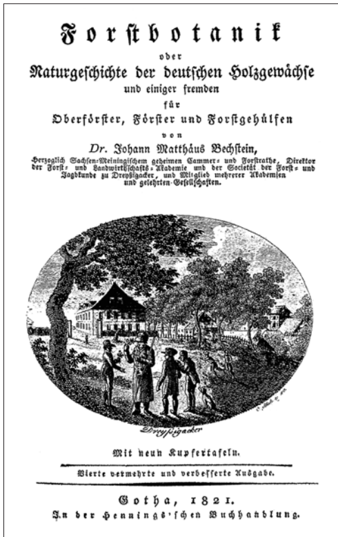
Abb. 1 Die „Forstbotanik“, das botanische Hauptwerk von J. M. BECHSTEIN, hier das Titelblatt der 4. Auflage von 1821

eller botanischer Werke, den „Taschenblättern der Forstbotanik“ (BECHSTEIN 1798) und schließlich seinem botanischen Hauptwerk, der „Forstbotanik, oder vollständige Naturgeschichte der deutschen Holzpflanzen und einiger fremden“ (BECHSTEIN 1810, Abb. 1).