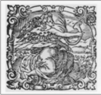
Abb. 2: Druckerzeichen „Tubablasende Fama“, Holzschnitt nach der Zeichnung von Jost Amman, ab 1574 verwendet, in: O'DELL (1993), S. 78.