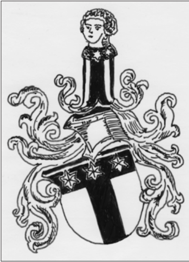
Abb. 4: Wappen der Züricher Familie Ammann, mit dem Jost Amman auch siegelte.

befristete Aufenthaltsbewilligung ausstellte: „ Jobsten Amman von Zuerich dem Reisser (= Zeichner) soll man auf sein supplicirn weil er mit dem reissen so geschickt sein soll ein Jar alhie zu sitzen Und aignen rauch zu halten (= Haushalt haben) vergunnen “. 4 Diese Bewilligung wurde im Januar 1577 „ aufnegskunftig Ostern “ verlängert, aber dann sollte Amman sich „ dess bürgerrechtens halben on langern verzug erkleren “. Amman reiste deshalb doch noch im zeitigen Frühjahr 1577 nach Zürich, da sich in der Sache nichts bewegt hatte. Endlich am 14. Juni 1577 erhielt er kostenfrei das Nürnberger Bürgerrecht, „ da er als Maler und Kunstreisser dieweil mit seiner Kunst so beruemt und trefflich “.